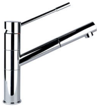
Miscelatore Lorenzo 8466 000