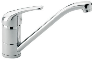
Miscelatore S1000 - RO 8443 002